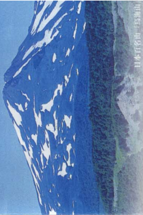
日本百名山「鳥海山」